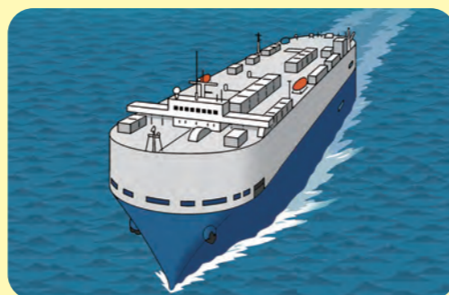
自動車専用船 (乗り物を運ぶ)