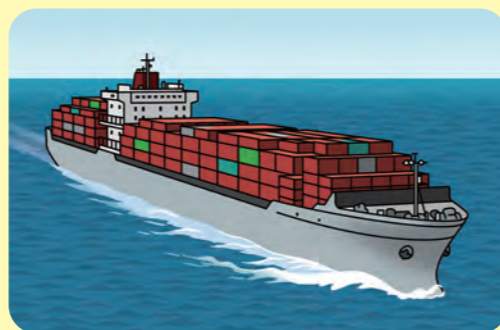
コンテナ船 (暮らしを運ぶ)