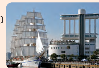
ポートビルと帆船「日本丸」