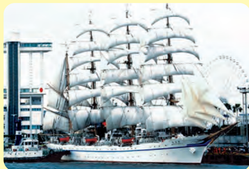
帆船 (風の力を利用して走る船)