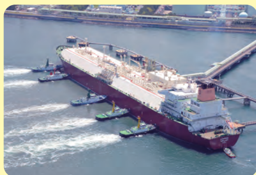
LNG船 (エネルギー資源を運ぶ船)