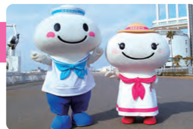
名古屋港のマスコット：ポータンとミータン

ふ頭とは、船を着けて、貨物の積み下ろしや人の乗り降りをする区域のことです。 ほかにも、昔はバナナふ頭と呼ばれ、現在は海洋スポーツ施設がある「大手ふ頭」、大型カーフェリーのターミナルがある「空見ふ頭」、航空宇宙産業が進出し、ロケットの積み出しも行われる「木場金岡ふ頭」など、名古屋港にはたくさんのふ頭や港湾施設があり、港の陸地部分の広さは日本一です。 (バンテリンドームナゴヤ約890個分)