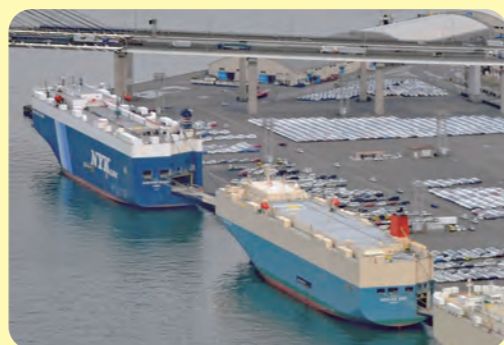
自動車専用船 (自動車輸送専用の船)