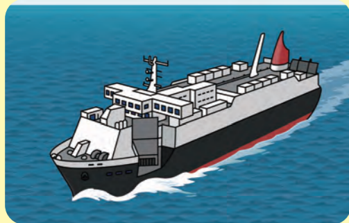
RORO船 (コンテナや自動車を運ぶ)