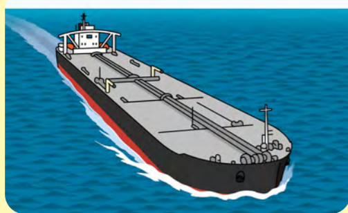
原油タンカー (エネルギー資源を運ぶ)