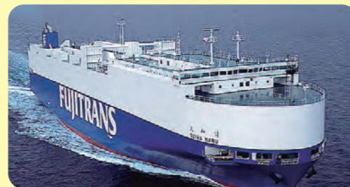
自動車専用船 (乗り物を運ぶ)