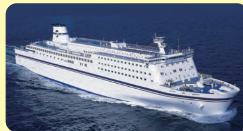
フェリー (人や乗り物を運ぶ)