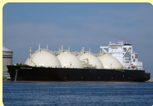
LNG船 (エネルギー資源を運ぶ)