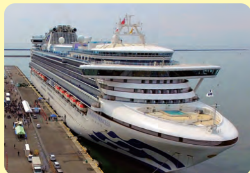
客船 (旅行や観光をする海上のホテル)