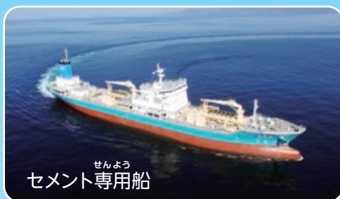
せんよう セメント専用船