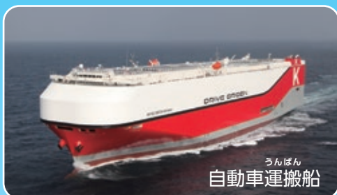
うんばん 自動車運搬船