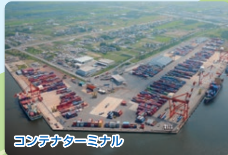
にい がた ひがしこう 新潟東港