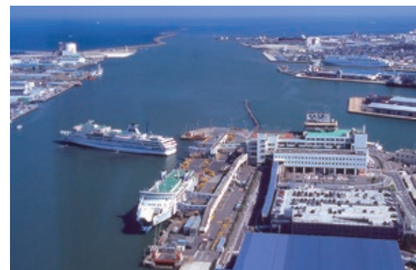
フェリーターミナル