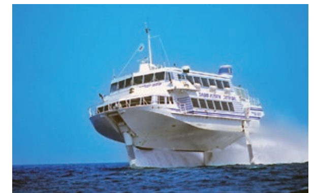
とてもはやい速度で海上移動ができるジェットフォイル