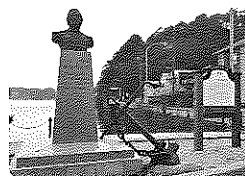
ペリー艦隊来航記念碑