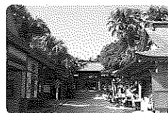
宮崎県・青島神社