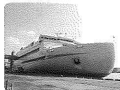
泉大津港にて阪九フェリー「いずみ」