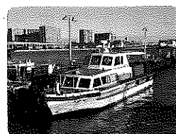
千葉港の通船「しまかぜ」